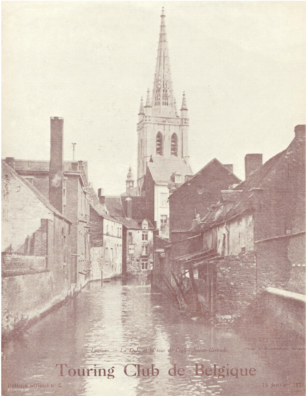
Louvain. — La Dyle et la tour de l'église Sainte-Getrude.

Vous trouverez ci-dessous le sommaire du N°2 du 15 janvier 1931 du Bulletin officiel du Touring Club de Belgique.